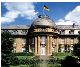
Abb.: Villa Reitzenstein, Staatsministerium Baden-Württemberg

Fahrt mit öffentlichen Verkehrsmitteln. Anmeldung erbeten bis 30. September. Begrenzte Teilnehmerzahl