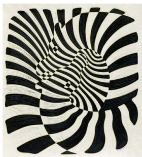
Abb.: Victor Vasarely, Zébres , 1932-1942