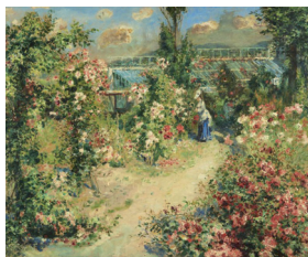
Abb.: Pierre-Auguste Renoir, Das Gewächshaus um 1876

TP Foyer um 13.30 Uhr Anmeldung erbeten bis 3. Dezember 2020