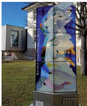
Abb.: Bürgerhaus Schönaich