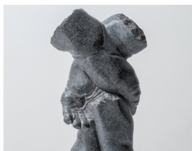
Abb.: C. Traub, Glieder, 2017 Granit H.A. Zirkelbach, Serie Roteisenstein VI

Eröffnung: Sonntag, 8. November 2020, 11.15 Uhr