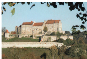
Abb.: Burghausen, Blick auf die Hauptburg

Anmeldung erbeten bis spätestens 23. März 2020