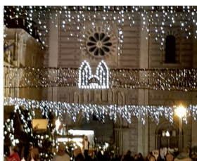
Abb.: Weihnachtsausfahrt 2019, Speyer

ganztägig, Fahrt im Reisebus Anmeldung erbeten bis 16. November