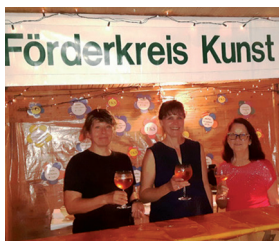
Abb.: Entengassenfest 2019

Wir bieten Waffeln in Variationen sowie gebrannte Mandeln